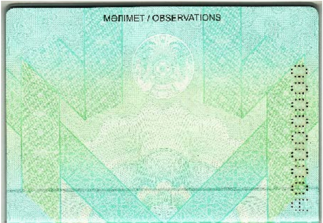
Рисунок № 14