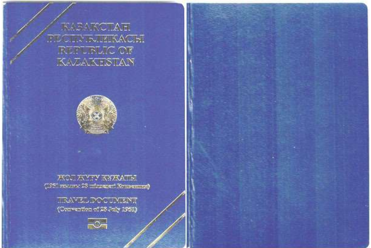
Рисунок № 1. Обложка.

11. Номера страниц проездного документа со страницы 4 по страницу 35 расположены в нижних углах.