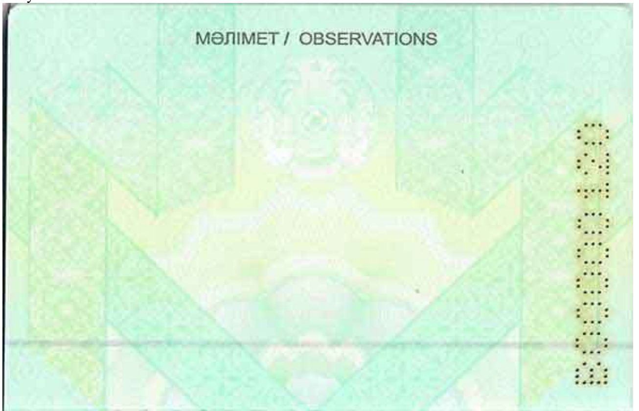
Рисунок № 5. Страница 4-36